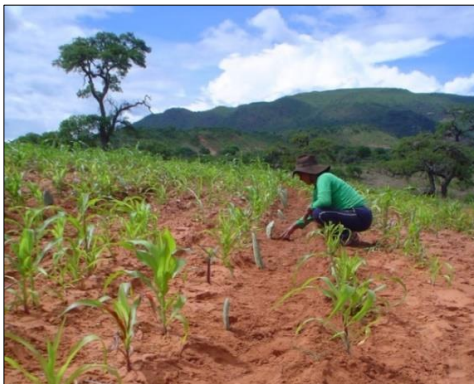
Figura 2. Plantación de tuna en Tabacal en marzo de 2015, en una parcela que ya tenía maíz en crecimiento

La parcela del cooperante, al momento de la plantación, estaba cultivada con maíz en una primera etapa de desarrollo. La plantación de la tuna no interfirió en el maíz, más al contrario, fueron complementarios, al ofrecer el maíz, la suficiente cantidad de sombra para evitar el daño a las pencas plantadas, por golpe de sol.