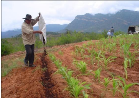
Figura 1. Aplicación de materia orgánica en surco, al momento de plantación

con 4 repeticiones. La fecha de plantación fue el 18 de marzo de 2015 (figuras 1 y 2 en Tabacal).