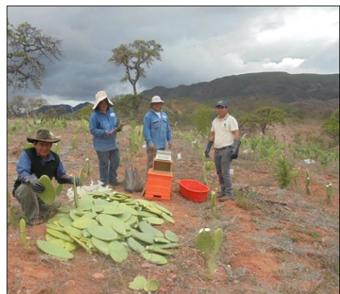
Figura 3. Poda de uniformización antes del establecimiento del ensayo en Tabacal, en febrero de 2019.

La plantación fue realizada en surcos espaciados a 2 metros, modificándose la densidad únicamente en el espacio de plantas dentro el surco. En febrero de 2019, se aplicó 200 kg/ha de urea, comparando con 200 kg/ha de fosfato di amónico (18-46-00), para conocer la influencia en la producción de forraje de tuna, en la parcela de Tabacal. Previamente a la fertilización química, se realizó la incorporación de tierra vegetal a razón de 10 t/ha para mantener humedad en las plantas y para que existan condiciones para una mejor adsorción de los nutrientes de los fertilizantes, por parte de las raíces de tuna. Se realizó también una poda de uniformización de las plantas de la parcela, dejando en primer piso (Figura 3). Se realizó la evaluación de rendimiento en materia seca, después de 10 meses desde la aplicación de los fertilizantes químicos.